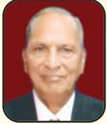
श्री जुगलकिशोर सिंघी बालिका छात्रावास