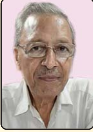
डॉ. श्याम सुंदर हरलालका राष्ट्रीय उपाध्यक्ष