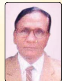
श्री दामोदर विदावतका राष्ट्रीय कोषाध्यक्ष