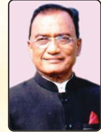
श्री अशोक जालान राष्ट्रीय उपाध्यक्ष