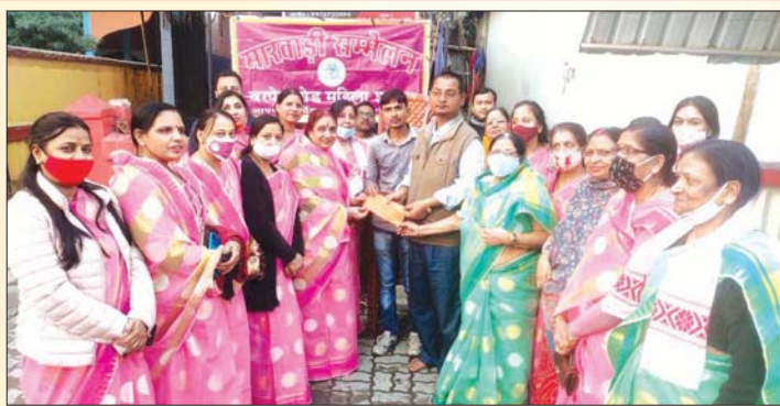
मारवाड़ी सम्मेलन, बरपेटा रोड महिला शाखा ने 19 दिसंबर 2020 को शनि मंदिर में चेंबर टेबल का वितरण एवं नगद राशि का दान किया।