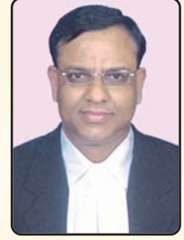
श्री पवन कुमार गोयनका राष्ट्रीय उपाध्यक्ष