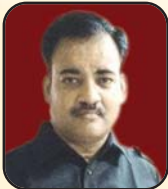
श्री नगर रतवा मंडल - ख